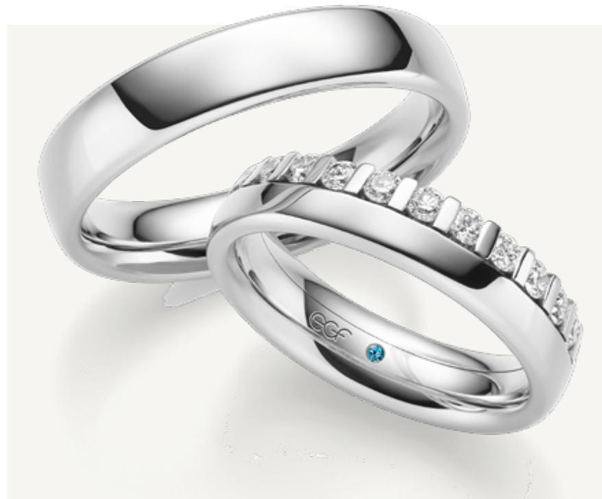
Weißer geht es nicht: Trauringe in der egf-Legierung River-Platin

Die egf Manufaktur war immer schon ihrer Zeit voraus, sei es bei den hohen Qualitätsansprüchen, der Digitalisierung mit dem Konfigurator, beim Thema Nachhaltigkeit oder beim Eingehen auf Kundenwünsche.